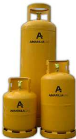
Garrafas de 10 y 15 y cilindro de 45 kg

Los usuarios del GLP como combustible en garrafas están ubicados principalmente en localidades alejadas de los gasoductos principales y troncales o en barrios sin redes de distribución de gas natural en poblaciones de menores recursos. Generalmente son poblaciones chicas cuyo abastecimiento de este producto (GLP) es fundamental durante el invierno. Es por ello que el transporte y distribución con garrafas tiene una importancia social vital para estas poblaciones. El precio del Gas Natural por redes (metano principalmente) es muy inferior al del GLP en garrafas.